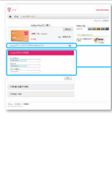
ノートPC / タブレット Laptop PC/Tablet

以前にご利用されたことがあり、「HotSpotアカウント」をお持ちの場合は、こちらでユーザー名(Eメールアドレス)とパスワードを入力してください。