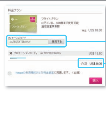
ノートPC / タブレット Laptop PC/Tablet

「お支払い方法」の画面で、「プロモーションコード」欄にお持ちのプロモーションコードを入力し、「使用する」ボタンを押してください。