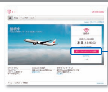
ノートPC / タブレット Laptop PC/Tablet