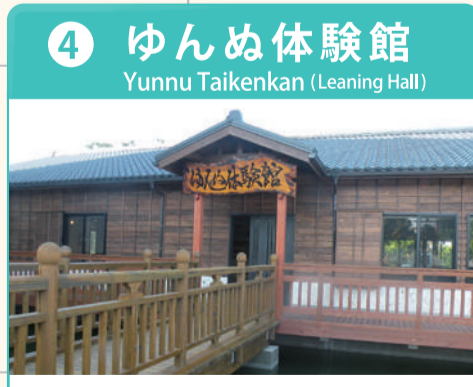
ヨロン島の文化や歴史などを学習できる施設。島に住む講師が指導するさまざまな体験メニューが用意されている。