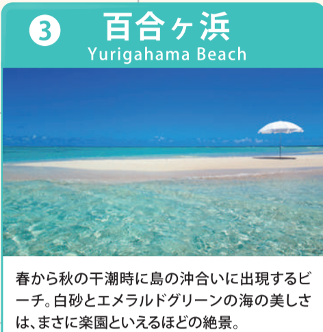
春から秋の干潮時に島の沖合いに出現するビーチ。白砂とエメラルドグリーンの海の見しさは、まさに楽園といえるほどの絶景。