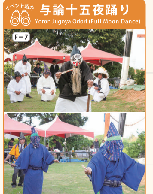
島の安泰と五穀豊穡を願う伝統の踊りで、旧暦の3月・8月・10月の15日に与論城にある琴平神社で奉納される。永禄4(1561)年当時の王が与論・琉球・大和の芸能をひとつにまとめたといわれる。各地の芸能の特色が混ざっているのが非常に珍しい。国指定重要無形民俗文化財。