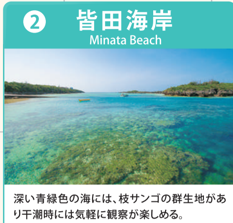
深い青緑色の海には、枝サンゴの群生地があり干潮時には気軽に観察が楽しめる。