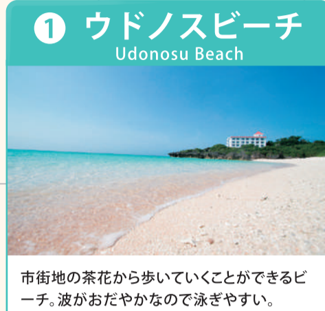
市街地の茶花から歩いていくことができるビーチ。波がおだやかなので泳ぎやすい。