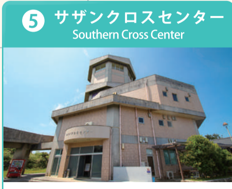
小高い丘に建ち、島の自然や文化、歴史、暮らし、芸能などに関する展示物が充実。晴れた日には5階展望台から近隣の島々が見渡せる。