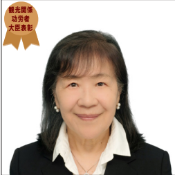
国土交通省 観光関係功労者大臣表彰