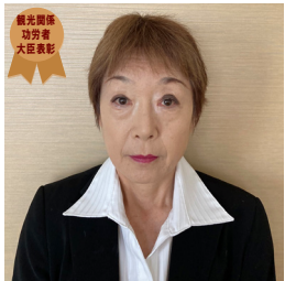
国土交通省 観光関係功労者大臣表彰