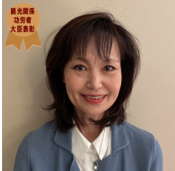
国土交通省 観光関係功労者大臣表彰