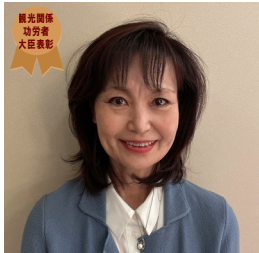
国土交通省 観光関係功労者大臣表彰