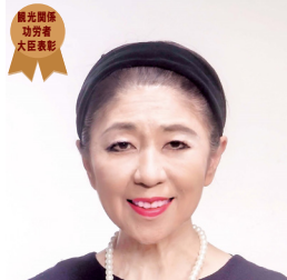
国土交通省 観光関係功労者大臣表彰