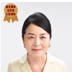
国土交通省 観光関係功労者大臣表彰