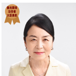
国土交通省 観光関係功労者大臣表彰