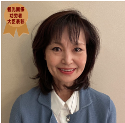
国土交通省 観光関係功労者大臣表彰