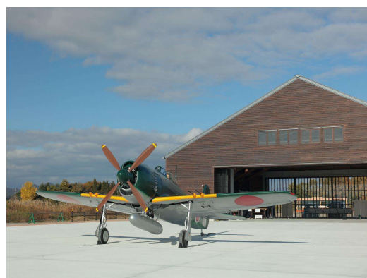
紫電改 実物大模型

https://www.city.kasai.hyogo.jp/soshiki/4/1780.html