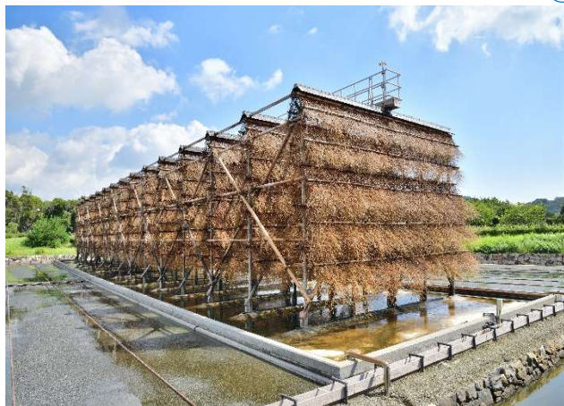
塩の国へようこそ！ 塩づくり体験