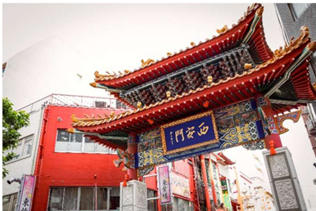
異国情緒あふれる街へ