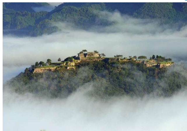
「日本のマチュピチュ」竹田城跡へ