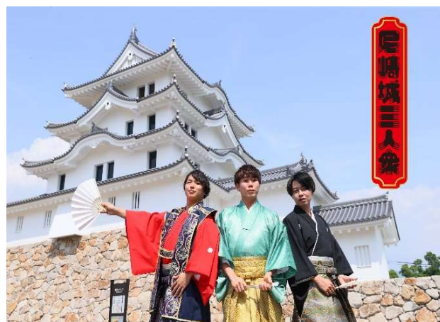
平成最後の城が令和の世に羽ばたく