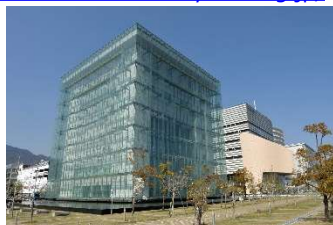
人と未来防災センター