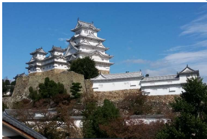
世界遺産・国宝 姫路城