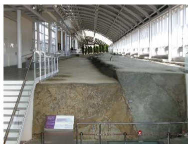
北淡震災記念公園

教育旅行で『震災の語りべ』の話をじっくり聞きたい団体のお客様は、セミナーハウスで話を聞いていただくことができます。