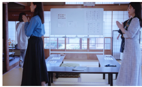
体験内容(イメージ)