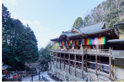
狸谷山不動院(イメージ)