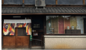
お醤油屋(イメージ)